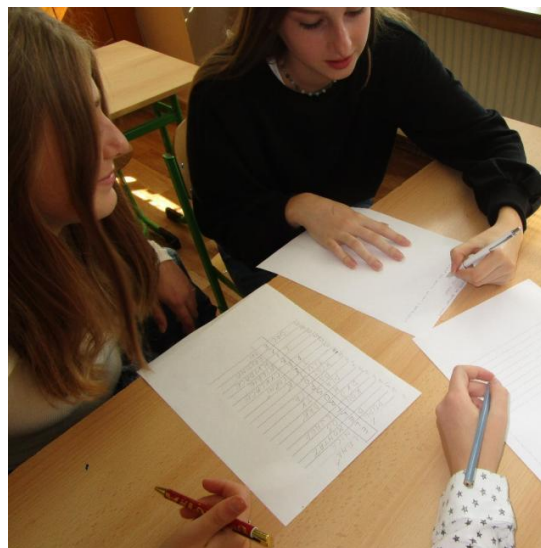
(Žáci IX. A)